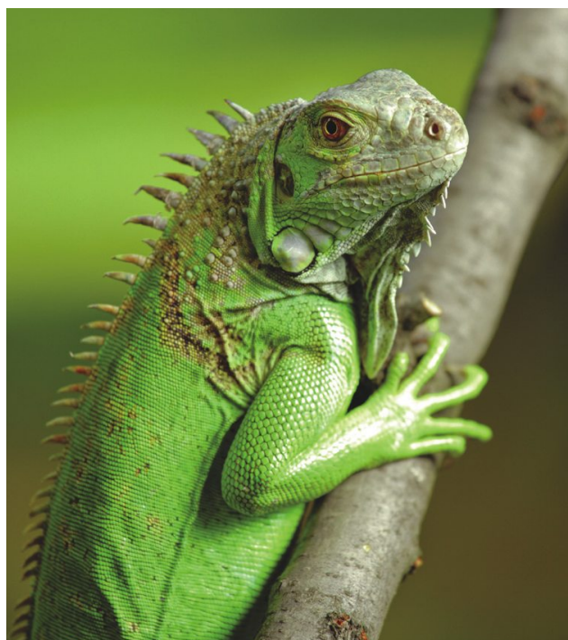
Iguana en un árbol